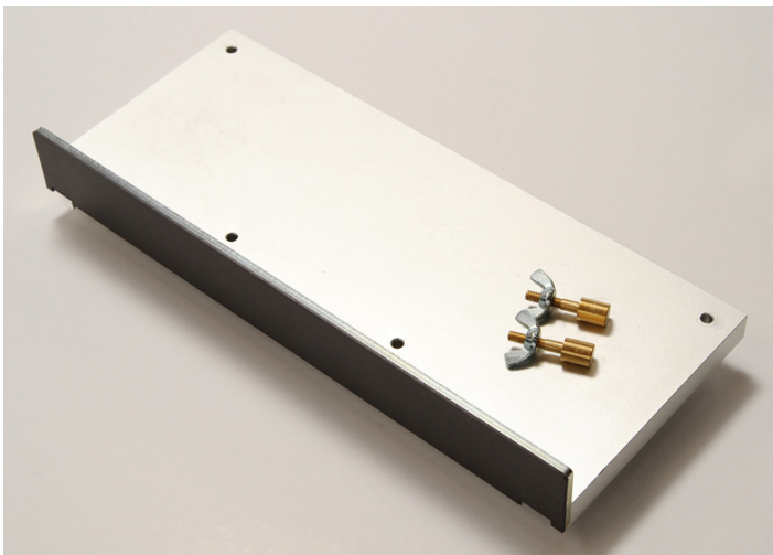
■250mm×100mm×10mm 高精度アルミ ■ガイドプレート幅：30mm ■材の最大カット幅：約230mm

厚さ10mmの本体にマグネットシートが貼られた30mm幅のガイドプレートが付いています。そこにノコ刃をつけ、材をまっすぐ直角に切ることができます。本体下部に2つある溝のどちらかに付属の金属フェンスを取付けて使用します。また付属の2つのピンを取付ければ、正確な45°の留め切りが可能です。フォトフレームづくりなどに適しています。MIRAIアルミ縦挽きガイドと共に使えば木組み製作の大幅な精度向上になります。自作の長さストッパーと共に使い、材を正確に同寸カットすることができます。様々な応用は本書をお読みください。